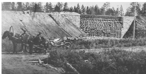
Строительство железной дороги

В 1908 году в (63 верстах) от Амура по р. Большой Невер, в месте, где железная дорога (по проекту) должна входить в долину этой реки образовывается поселение п. «Змеинный».